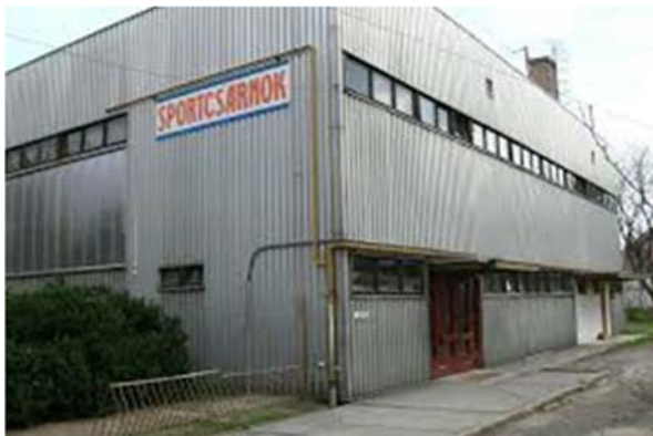
Városi sportcsarnok (régí csarnok) Ipolypart út 5.