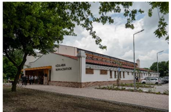
Kézilabda Munkacsarnok (új csarnok) Nádor utca 28.