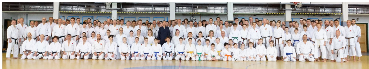
2018. Palóc Gasshuku - Gyöngyös